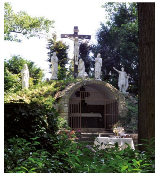
De Calvarieberg in het Kruiswegpark.

Sinds vorig jaar zijn er contacten geweest met het bestuur van het Kruiswegpark. Men zoekt samenwerking en Rura vindt het van belang dat het Kruiswegpark ook na zijn eeuwfeest nog lange tijd toegankelijk blijft voor bezoekers. René Roosjen, Rura-bestuurder, zal toetreden tot het bestuur van de Stichting Kruiswegpark. De activiteiten en bestuurlijke verantwoordelijkheden moeten goed gescheiden blijven, maar via een gedeeltelijke personele unie is aan de kans op een goede toekomstige samenwerking tussen beide stichtingen in elk geval inhoud gegeven. Overigens was er ook elders een personele samenwerking, namelijk met het Comité 800 jaar Munsterkerk waarvan onze penningmeester Frank Slenders secretaris was.